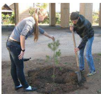
Акция «Живи, лес»

Патриотизм невозможен без любви к своему Отечеству, поэтому было запланировано проведение мероприятий и экологических акций: «Я люблю свой город», «Сохраним планету для потомков», «Дубок», «Летопись добрых дел по сохранению природы»; «Мой город – чистый город!», включающий участие в конкурсах рисунков, плакатов, фотографий, стихов и участие в акциях по уборке нашего города, посадке деревьев и цветов: «Дубок», «Живи, лес», «Живи, родник!». Так в рамках акции «Дубок» жителями микрорайона ТОС №10, студентами Дубовского педагогического колледжа и учащимися МКОУ СОШ №1 в городском парке было высажено более 100 саженцев дуба (апрель 2012г.). А при проведении акции «Живи, лес» совместно с работниками Дубовского лесничества МКУ «Межпоселенческий социально - досуговый центр молодежи» на территории МКОУ СОШ №1 было высажено 50 саженцев ясеня и 20 саженцев ели (октябрь 2012 г.)