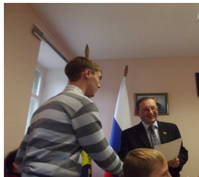
Ветераны на линейке 1 сентября 2012 г., уроках мужества: